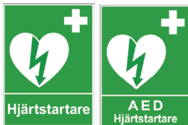
Figur 1— Exempel på skyltar enligt HLR-rådet

Hänvisningsskylt(ar) ska finnas i den utsträckning som motiveras av lokalers storlek och avstånd till hjärtstartaren.